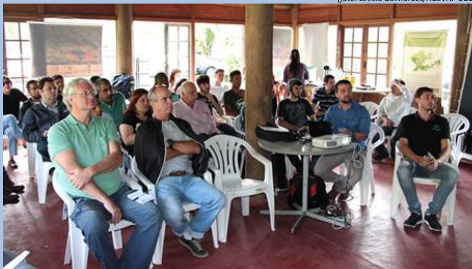
Membros do CBH-Piabanha participam da 58ª Reunião Ordinária conjunta

A 58ª Reunião Ordinária do Comitê Piabanha foi realizada no dia 18 de abril, em Petrópolis. O encontro teve como pauta a aprovação da plenária anterior e da Resolução CBH-Piabanha nº 39 de 2017, referente às diárias, ajudas de custo e reembolso. Durante a reunião foram discutidas e aprovadas as atividades do Grupo de Trabalho (GT) de Sistemas de Informações, do Diretório Colegiado e da Câmara Técnica (CT) sobre a utilização do Plano de Bacia do CEIVAP. Os diretores do Comitê explanaram sobre a metodologia da cobrança de uso da água pela CT, sobre o andamento da Ação Civil Pública para liberação dos recursos do Fundo Estadual de Recursos Hídricos (FUNDRHI) e sobre o andamento dos trabalhos de mobilização entre Prefeituras e Comitê. Ao final da reunião, houve a apresentação sobre as atividades realizadas pelo CBH-Piabanha no primeiro trimestre de 2017.