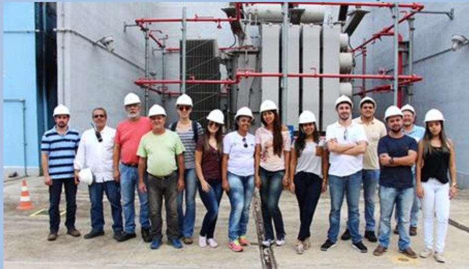
Visita técnica ao Aproveitamento Hidrelétrico de Simplício

Representantes do Comitê Piabanha, da equipe da Associação Pró-Gestão das Águas da Bacia Hidrográfica do Rio Paraíba do Sul (AGEVAP) e da Secretaria Municipal de Meio Ambiente de Sapucaia fizeram uma visita técnica aos Aproveitamentos Hidrelétricos de Anta e Simplício, no dia 26 de abril. O objetivo foi mostrar aos visitantes a importância das duas unidades que, juntas, geram energia suficiente para abastecer uma cidade com cerca de 800 mil habitantes. As áreas estão situadas no Rio Paraíba do Sul, na região de Sapucaia, e pertencem a Região Hidrográfica IV, correspondente a região de atuação do Comitê Piabanha.