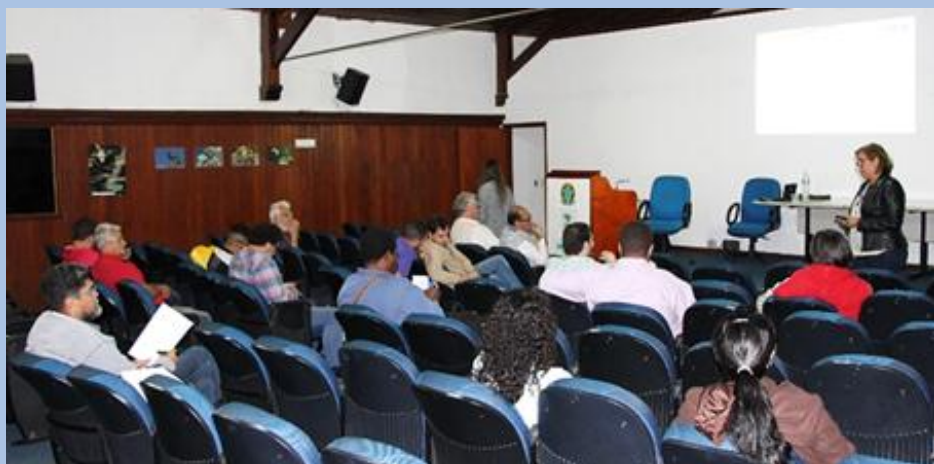
Integrantes da Câmara Técnica encontram-se para a 36ª Reunião

A 36ª Reunião da Câmara Técnica (CT) foi realizada em Teresópolis, no dia 27 de abril. O principal assunto abordado foi a metodologia de cobrança pelo uso de recursos hídricos na Região Hidrográfica IV, área de abrangência do Comitê.