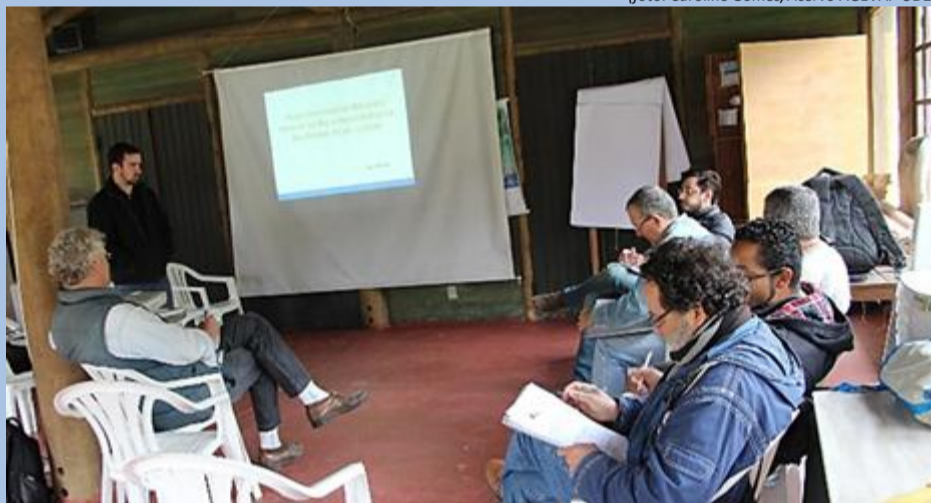
Integrantes do Grupo de Trabalho Plano de Bacia conversam sobre Termo de Referência