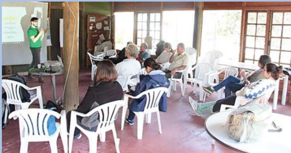
Grupo de Trabalho de Saneamento do Comitê Piabanha se reúne na APA Petrópolis

No dia 11 de agosto, na sede da Área de Proteção Ambiental de Petrópolis, o Grupo de Trabalho de Saneamento do Comitê Piabanha realizou sua 5ª reunião do ano. O encontro teve como pauta a definição sobre a aplicação dos recursos disponíveis do programa “Saneamento e Qualidade da Água” do Plano de Aplicação Plurianual (PAP) do Comitê Piabanha; o andamento da avaliação do Planos Municipais de Saneamento Básico; informe sobre Companhia Águas do Imperador e sobre a possibilidade de implementação do projeto “Observatório de Saneamento” da Escola Nacional de Saúde Pública Sérgio Arouca (ENSP/Fiocruz); e o enquadramento de Corpos Hídricos.