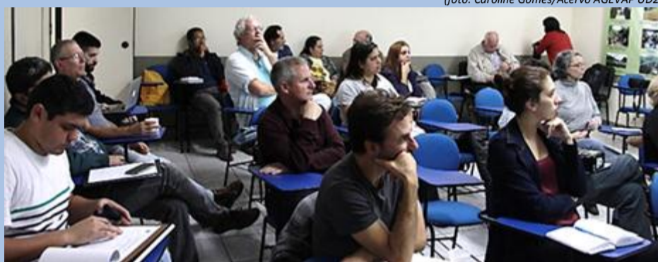
Comitê Piabanha se reúne na EMATER