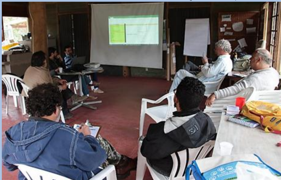
Grupo de Trabalho Sistemas de Informações debate sobre dados do BDE