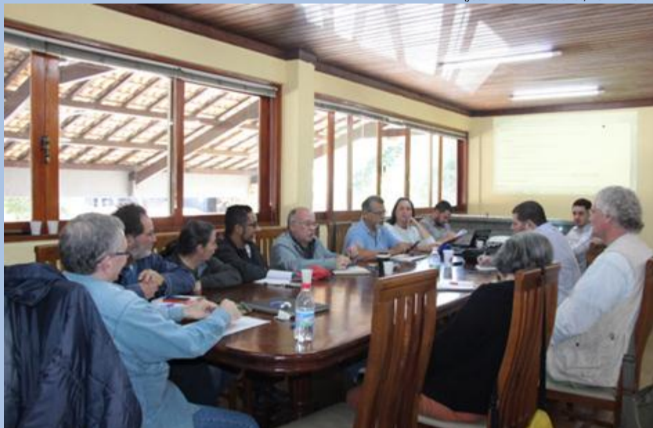
Membros da CT e coordenadores do GT se reúnem em Itaipava/RJ

A 7ª Reunião Extraordinária da Câmara Técnica do Comitê Piabanha foi realizada no dia 27 de julho, em Itaipava/RJ. Com a presença dos membros da Câmara e dos coordenadores dos Grupos de Trabalho (GT's) do Comitê, a reunião teve como pauta o andamento das atividades dos GT's e seus objetivos. O tema também será discutido na próxima reunião do Diretório, onde também serão definidas propostas de adequação desses grupos, de acordo com o Regimento Interno do Comitê Piabanha.