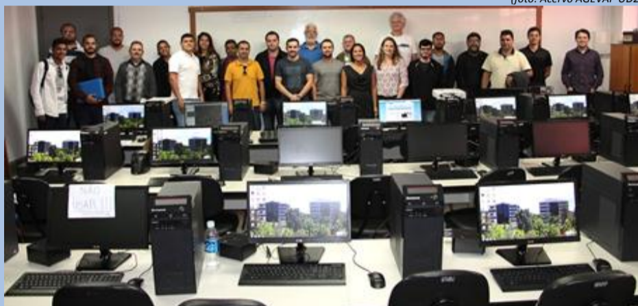
Participantes do treinamento SIGA-CEIVAP na UNIFESO, em Teresópolis

No dia 4 de maio, foi realizada a 7ª Reunião do Grupo de trabalho Sistema de Informações, no Centro Universitário Serra dos Órgãos (UNIFESO), no município de Teresópolis. Na ocasião foi realizado um treinamento na plataforma SIGA-CEIVAP, para técnicos das Prefeituras da RH-IV, membros do Comitê Piabanha e alunos da UNIFESO.