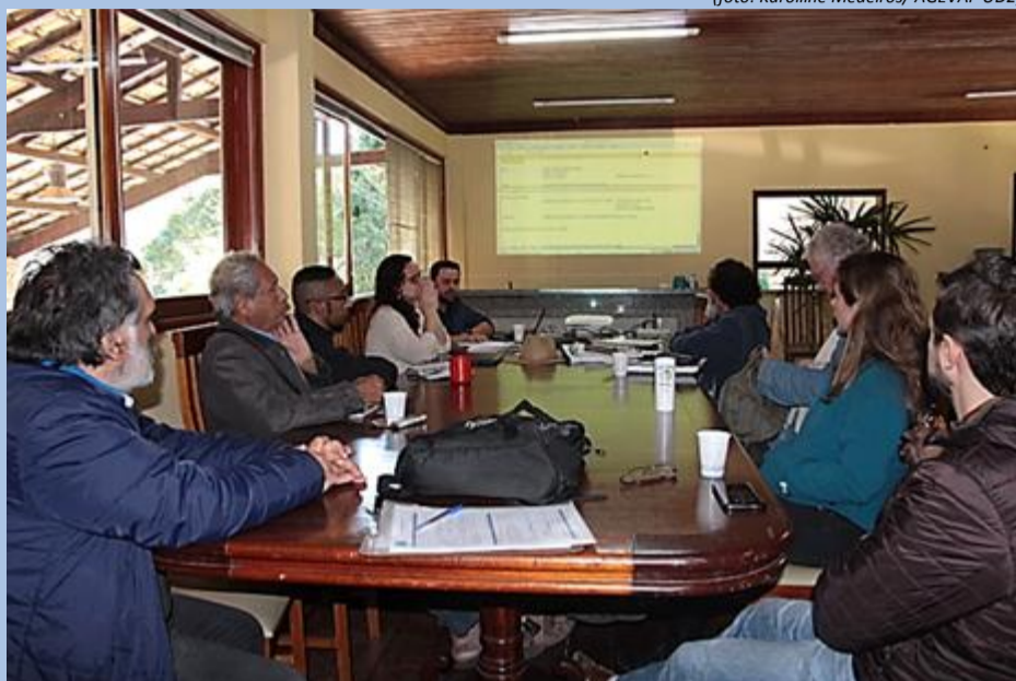
Membros se reúnem para reuniões do GT Educomunicações e GT Sistemas de Informação

Duas reuniões dos Grupos de Trabalho do Comitê Piabanha foram realizadas no dia 21 de maio, na Secretária de Serviços, Segurança e Ordem Pública, em Itaipava. Durante a 4ª Reunião do Grupo de Trabalho Educomunicação, os membros discutiram sobre a definição de objetivos do GT para 2018 e 2019, como a avaliação do atual Plano de Comunicação e suas propostas de atualização.