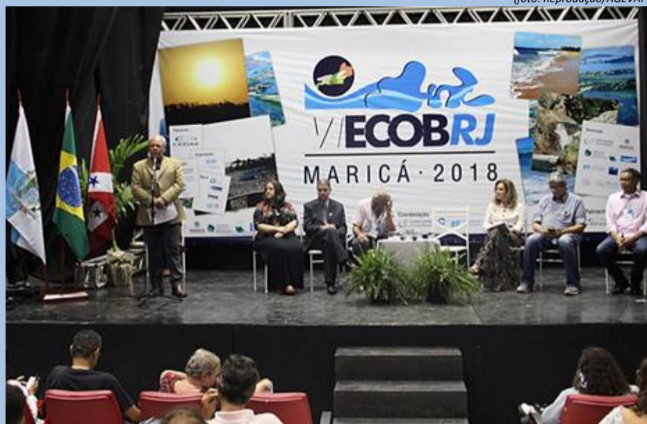
Cerimônia de Abertura da início ao VI ECOB RJ

A sexta edição do ECOB RJ – Encontro Estadual de Comitês de Bacias Hidrográficas do Estado do Rio de Janeiro foi realizado nos dias 16 e 17 diante de um auditório lotado em Maricá/RJ.