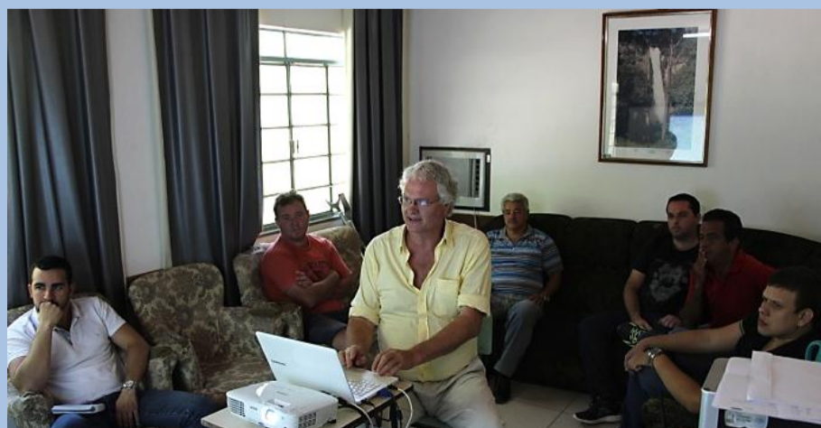
Reunião na Secretaria de Meio Ambiente de Sumidouro.