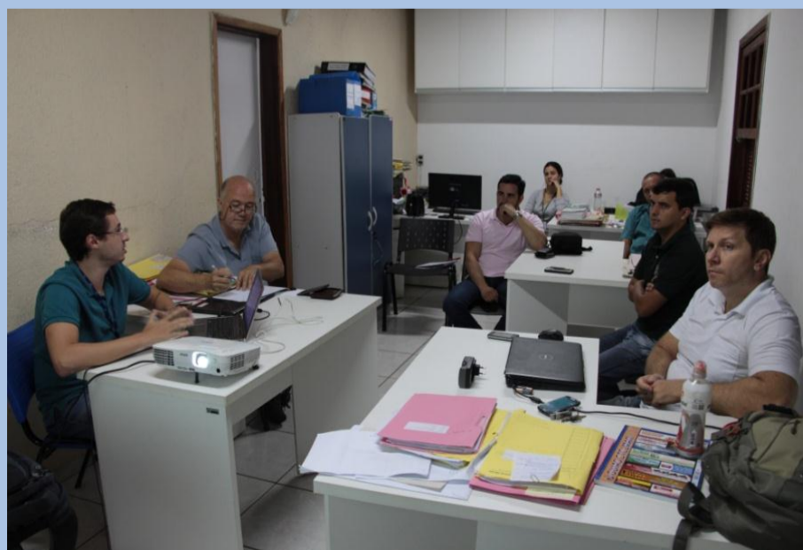
Reunião na Secretaria de Meio Ambiente de Três Rios