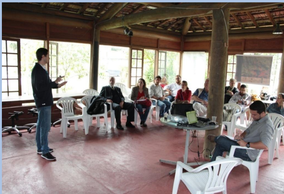
4ª Reunião do Grupo de Trabalho de Saneamento

O Comitê Piabanha realizou, no dia 21 de março, a 4ª Reunião do Grupo de Trabalho de Saneamento, no município de Petrópolis, Rio de Janeiro. Na ocasião foram discutidos os seguintes assuntos como a apresentação/aprovação do Termo de Referência do Curso de Biosistemas e tópicos sobre saneamento levantados na visita à prefeitura de Teresópolis, dentre outros.