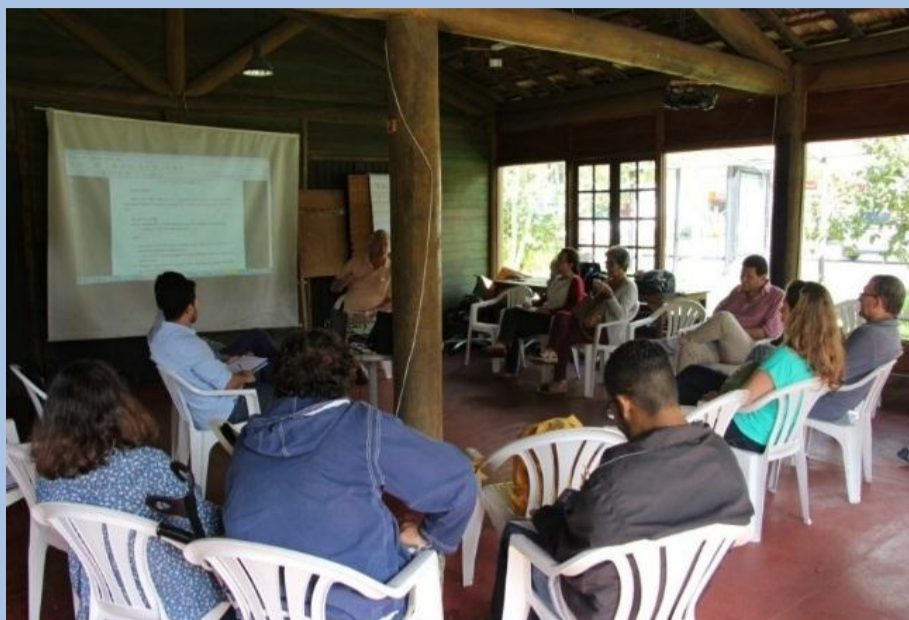
35ª Reunião da Câmara Técnica

O Comitê Piabanha realizou, no dia 24 de março, a 35ª Reunião da Câmara Técnica. O plenário, que aconteceu no município de Petrópolis, debateu os seguintes assuntos: aprovação das atas da 34ª Reunião da Câmara Técnica, assim como das atas da 2ª, 3ª e 4ª Reuniões Extraordinárias da Câmara Técnica; avaliação final do Termo de Referência do Plano Estratégico de Recursos Hídricos do Comitê Piabanha; definição de cronograma para a discussão sobre a metodologia da cobrança pelo uso da água na Região Hidrográfica IV; entre outros.