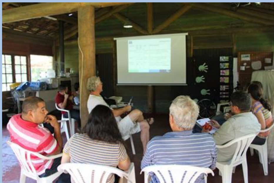
Membros da Câmara Técnica Institucional do Comitê reúnem-se para sua 42ª reunião

A 42ª Reunião da Câmara Técnica Institucional foi realizada no dia 12 de março, no município de Petrópolis. Na ocasião, os membros conversaram sobre as discussões da Câmara Técnica acerca da metodologia da cobrança pelo uso da água e, em seguida, discutiram sobre a sustentabilidade financeira do Comitê. Ao final do encontro, os presentes sugeriram os assuntos que poderão ser discutidos no ECOB/RJ, que será realizado nos dias 17 e 18 de maio, em Maricá.