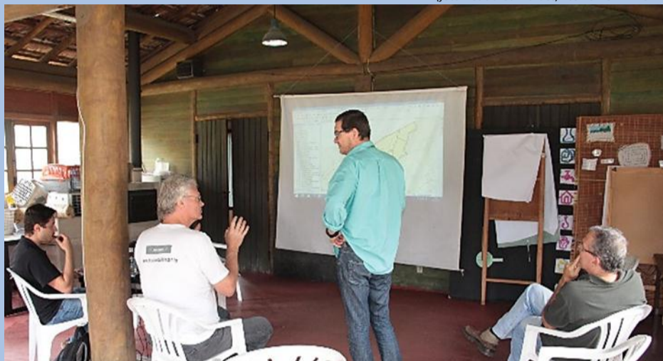
Membros do Grupo de Trabalho Sistemas de Informações reúnem-se em Petrópolis